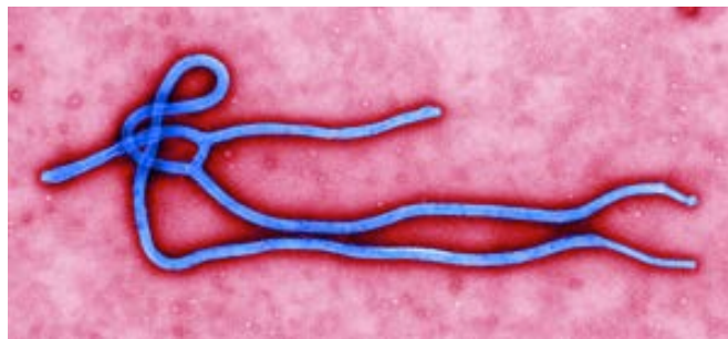
Fig. 1 – Immagine al microscopio del virus Ebola

Secondo Broderick, docente di patologia vegetale all'università del Delaware, il virus Ebola sarebbe in realtà un organismo geneticamente modificato e creato nei laboratori del dipartimento della Difesa negli Usa. Le prove volte a rafforzare questa teoria traggono spunto dal testo “ Emerging Viruses: AIDS and Ebola - Nature, Accident or Intentional ” (Horowitz, 1996), citando ancora una volta anche l'AIDS e la genesi cospirativa della malattia infettiva.